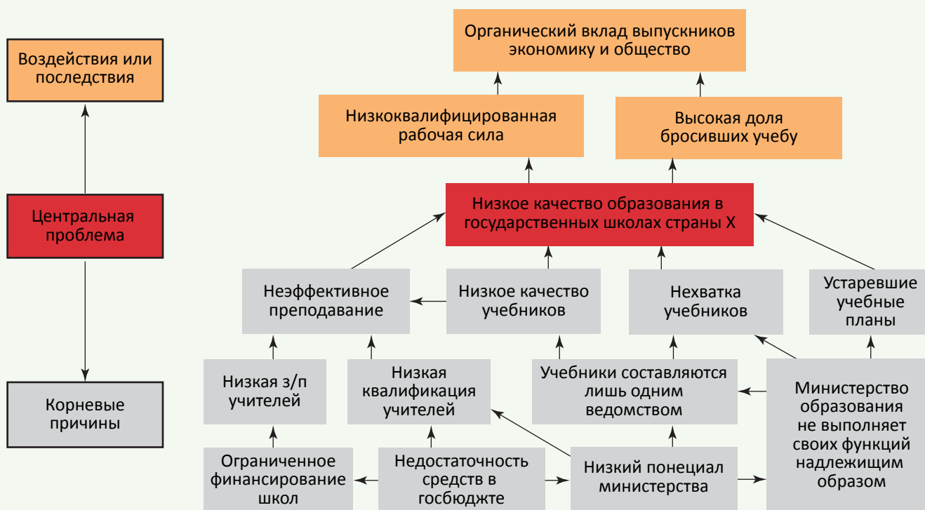
Иллюстрация 2. Пример анализа с помощью древа проблем