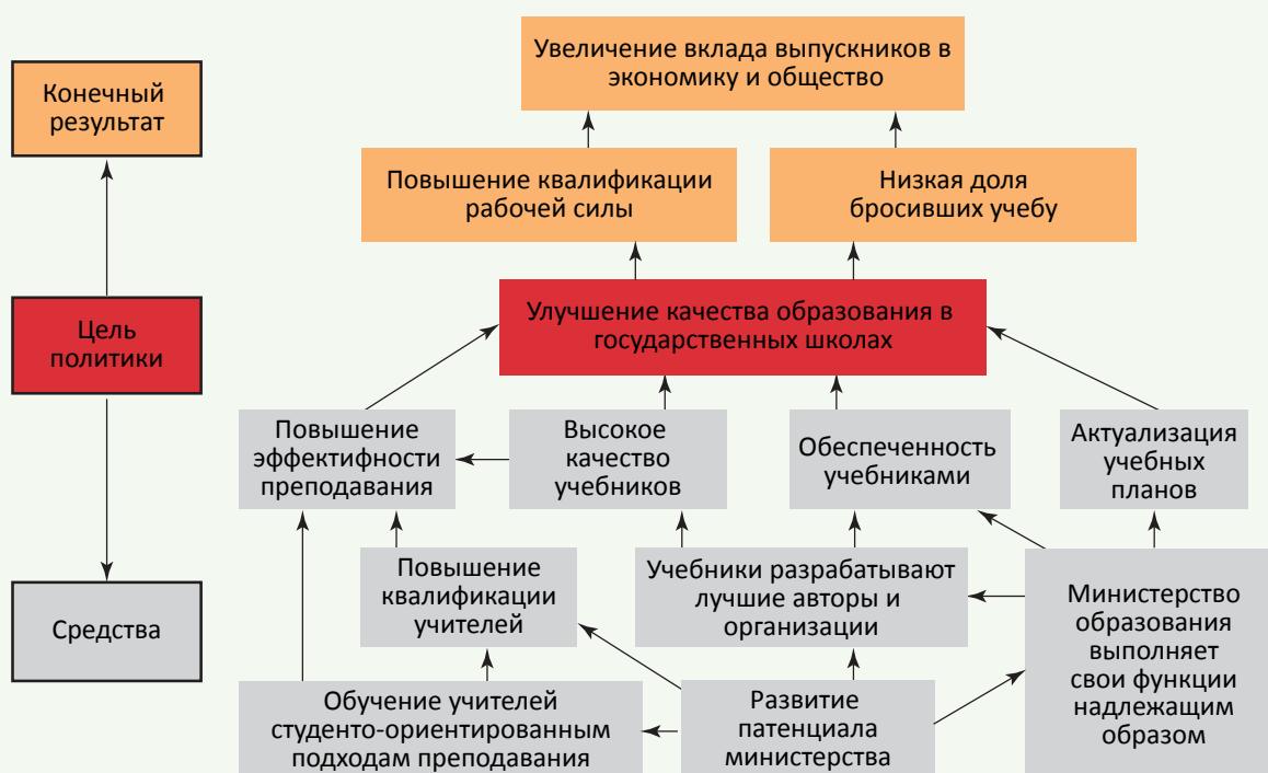
Иллюстрация 3. Пример дерева решения

Пример такого обратного дерева, которое также известно под названием “дерево решений” (solution tree или objective tree), приводится ниже.