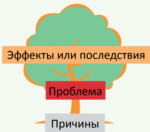
Иллюстрация 1. Древо проблемы

Древо проблемы может применяться для выявления проблемы и определения причинно-следственных связей между факторами. Это средство помогает аналитикам отделить друг от друга и наглядно расположить основные факторы и поделить их на три категории: основной точкой является Проблема, т.е. сама ситуация (ствол дерева); корни проблемы – это причины (корни дерева), а симптомы или воздействия (последствия) проблемы – это ветви дерева. После этого специалист может определить причины, по которым существуют корни, а также как причинные и симптоматические факторы связаны друг с другом (см. Иллюстрацию 2 ниже). Это упражнение может помочь определить точки вмешательства – те корни, на которые указывают больше всего стрел. Этот этап также может помочь аналитикам уточнить и исправить формулировку проблемы.