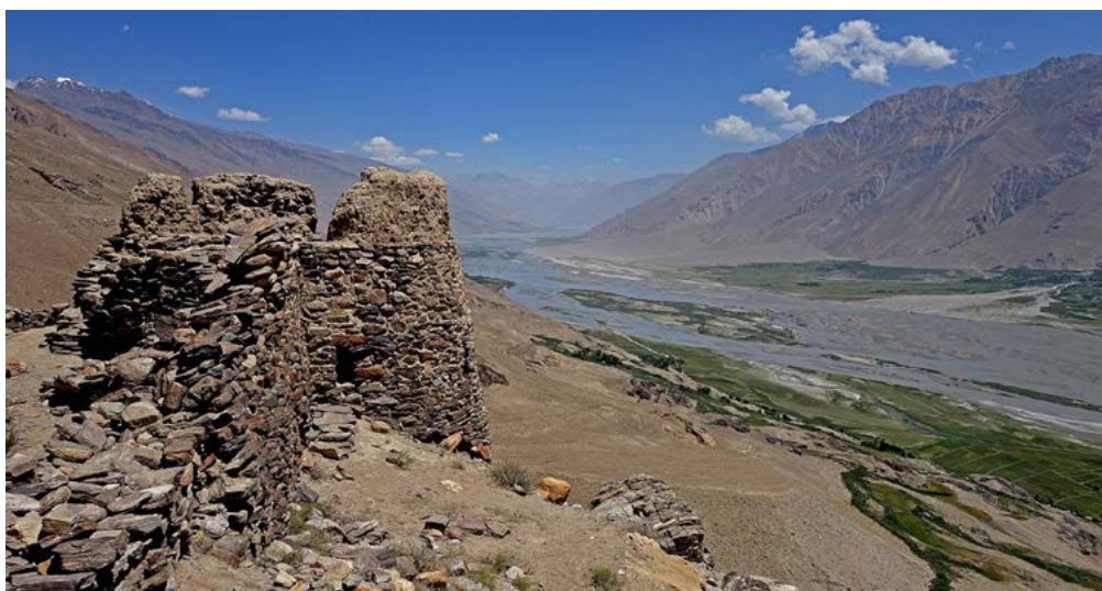
Река Пяндж, разделяющая Вахан на Таджикистан (слева) и Афганистан (справа): Вид с руин крепости Ямчун, построенной в Кушанский период (50 до н. э. – 225 н. э.).

Благодаря своему географическому расположению – множественные горные перевалы и реки соединяли его с Китаем, Индией и Бактрией, Вахан играл важную роль в торговых и прочих контактах древнего мира. Столица Сакашим («город саков», ныне известный как Ишкашим, располагающийся на левом берегу реки Пяндж) описывалась в персидской географической книге девятого века «Худуд ал-алам» («Регионы Мира») как процветающий город, где мирно сосуществовали разнообразные общины – коренные и недавно основанные мусульманские (Минорский, 1980:121). Однако упадок Шелкового пути в период китайской династии Тан, правившей в X веке, и затем активизация морских маршрутов в XV веке ослабили позицию Вахана, как и прочих наземных пунктов: экономическая деятельность значительно снизилась и целостность политической структуры пошатнулась. За всю историю своего существования Вахан смог сохранить определенную независимость под протекторатом более крупных региональных держав, таких как Сасаниды (224–651), Эфталиты (440-е–670), Турецкий Каганат (551–744), Тибетцы (618–842), китайская династия Танг (861–907), Персидские Саманиды (819–999) и позднее – турецко-монгольские династии Центральной Азии вплоть до завоевания афганцами (левый берег) и русскими (правый берег) в конце XIX века (Искандаров 1983, Бубнова 2005).