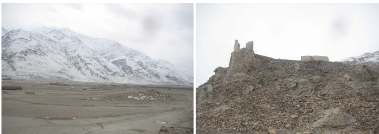
Панорамный вид Кала-и Пянджи – бывшей столицы Ваханского княжества (слева) и развалины старой крепости (справа). Фото было сделано в январе 2012 года.

Кроме того, Джахан Хан упоминается как отец невесты правителя Бадахшана, Замануддина, также известного как Мир Шах (Бобринской 1908: 62). Помимо этого, его указывают как человека, который приказал разработать план и строительство замка Пянджа ( Кала-и Пянджа ) на левом берегу реки Пяндж для использования в качестве резиденции ваханских правителей (Бобринской 1908: 63). Кала-и Пянджа или просто Пянджа служила столицей Вахана до начала XX века, после чего Хандут стал новым центром округа в Афганском Вахане. Местные пахотные земли и стратегическое расположение замка были, пожалуй, главными причинами для размещения здесь правительственной резиденции. Территория была близка к Хунзе и Читралу, с правителями которых ваханские миры были в хороших отношениях и где они часто скрывались во время военных набегов со стороны Бадахшана.