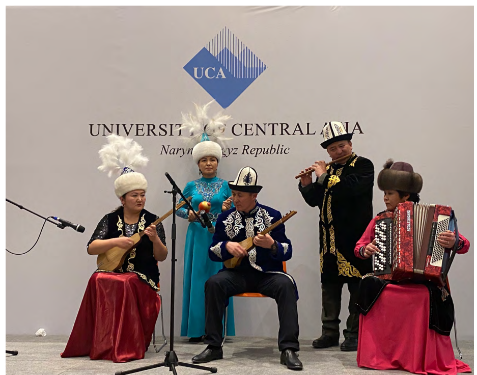
Ансамбль музыкальной школы в Нарыне исполняет музыку на инструментах разных культур на праздновании Навруза.

Кампус УЦА в Нарыне также провел показ мод, представляющий разнообразный студенческий состав кампуса. В Хорогском кампусе студенты, сотрудники и представители местного сообщества участвовали в соревновательных играх, включая борьбу, перетягивание каната и волейбол.