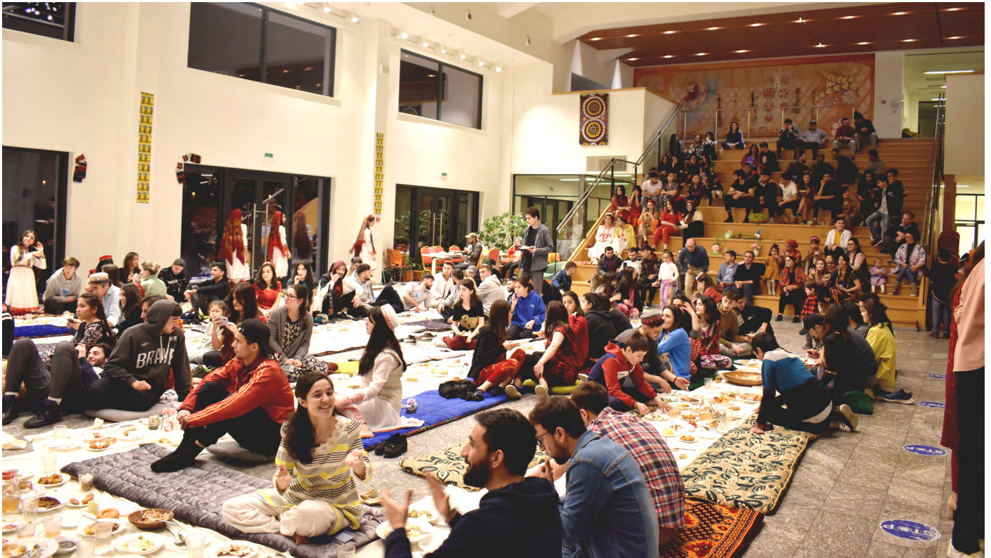
Участники собираются, чтобы насладиться ужином и представлениями во время празднования Навруза в кампусе Хорога.

Праздник Навруз, отмечаемый в Иране уже более 3 000 лет, знаменует приход весны как победу над тьмой. Праздник пережил несколько завоеваний Персии и распространился по всему миру благодаря диаспоре персидского народа. Навруз символизирует время духовного обновления и физического омоложения, а также надежды и оптимизма в жизни. Окончание суровых зим и начало нового жизненного цикла на земле отмечают во всех странах Центральной Азии.