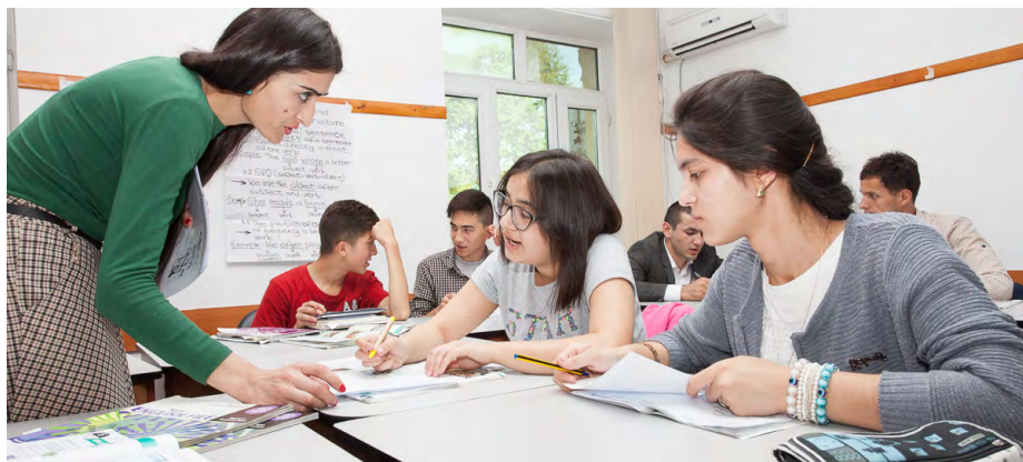
Урок английского языка в ШПНО в Хороге.

Автор отмечает, что родители в ГБАО демонстрируют значительно более высокие образовательные ожидания от своих детей, по сравнению с другими регионами Таджикистана. Результаты исследования показывают, что взрослые в ГБАО тратят значительно больше ресурсов на детей