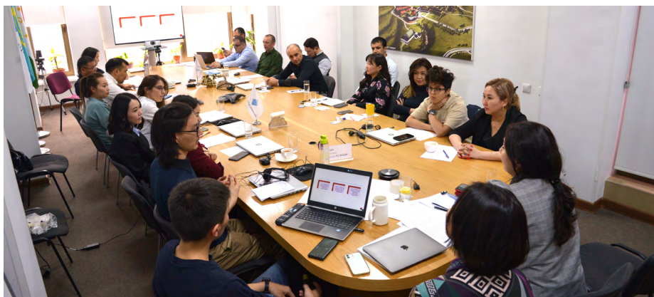
Сотрудники офиса в Бишкеке ведут глубокую дискуссию об эффективном общении.

От управления стрессом до эффективного общения: понимание и управление эмоциями важно не только на рабочем месте, но и помогает лучше смотреть на жизнь.