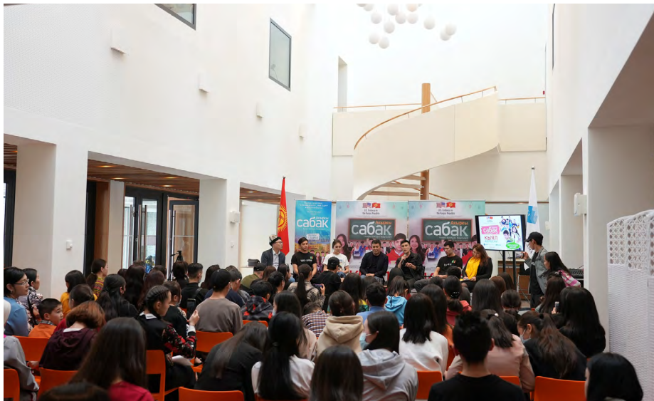
Актёры сериала «Акыркы сабак» в Нарынском кампусе УЦА убеждают старшеклассников в важности высшего образования.

Наконец-то появился сериал, который молодые и пожилые могут смотреть всей семьей. Новый 10-серийный драматический сериал Руслана Акуна «Акыркы сабак» («Последний урок») в одночасье стал популярным в Кыргызстане. В настоящее время он имеет 18,8 млн просмотров на YouTube и еще 14 млн просмотров в прямом эфире на национальном телеканале КТРК.