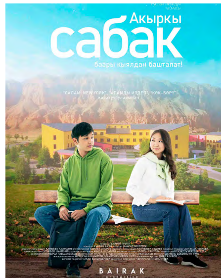
Афиша сериала «Акыркы сабак».

Сериал обсуждали в парламенте Кыргызстана, и различным министрам были даны задания помочь решить социальные проблемы, освещенные в сериале.