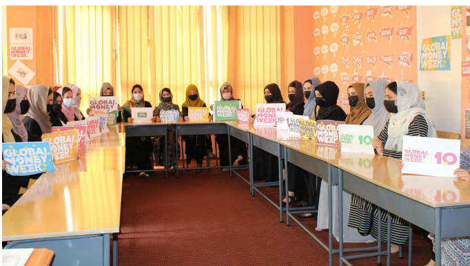
Около 70% участников семинара по финансовому управлению в Афганистане составляли женщины.

Различные учебные центры Школы профессионального и непрерывного образования УЦА отметили Глобальную неделю денег, пригласив известных специалистов для обучения студентов важным понятиям финансовой грамотности, составления семейного бюджета и смежным темам.