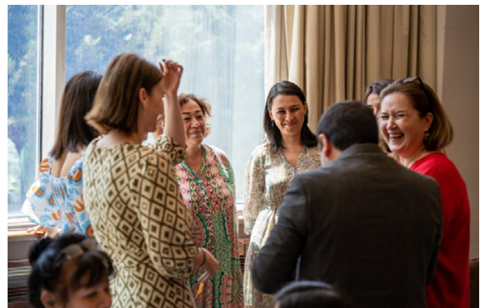
Участники во время групповых дискуссий в Душанбе, Таджикистан

Короткое видео мероприятия в Бишкеке и Душанбе .