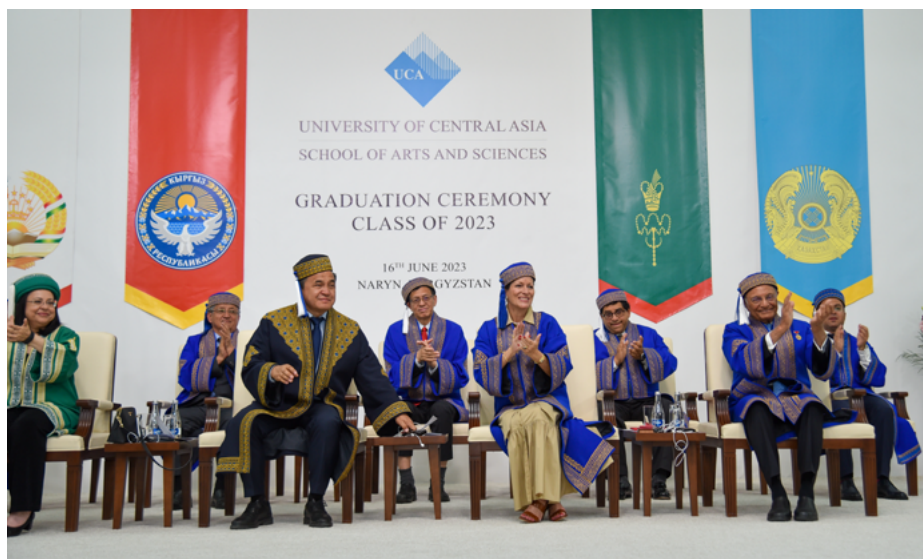
Выпускная церемония в кампусе УЦА в Нарыне.