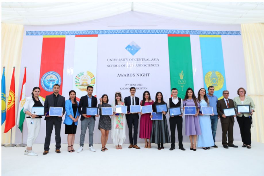
Выпускники и преподаватели демонстрируют свои наградные грамоты в кампусе в Хороге.