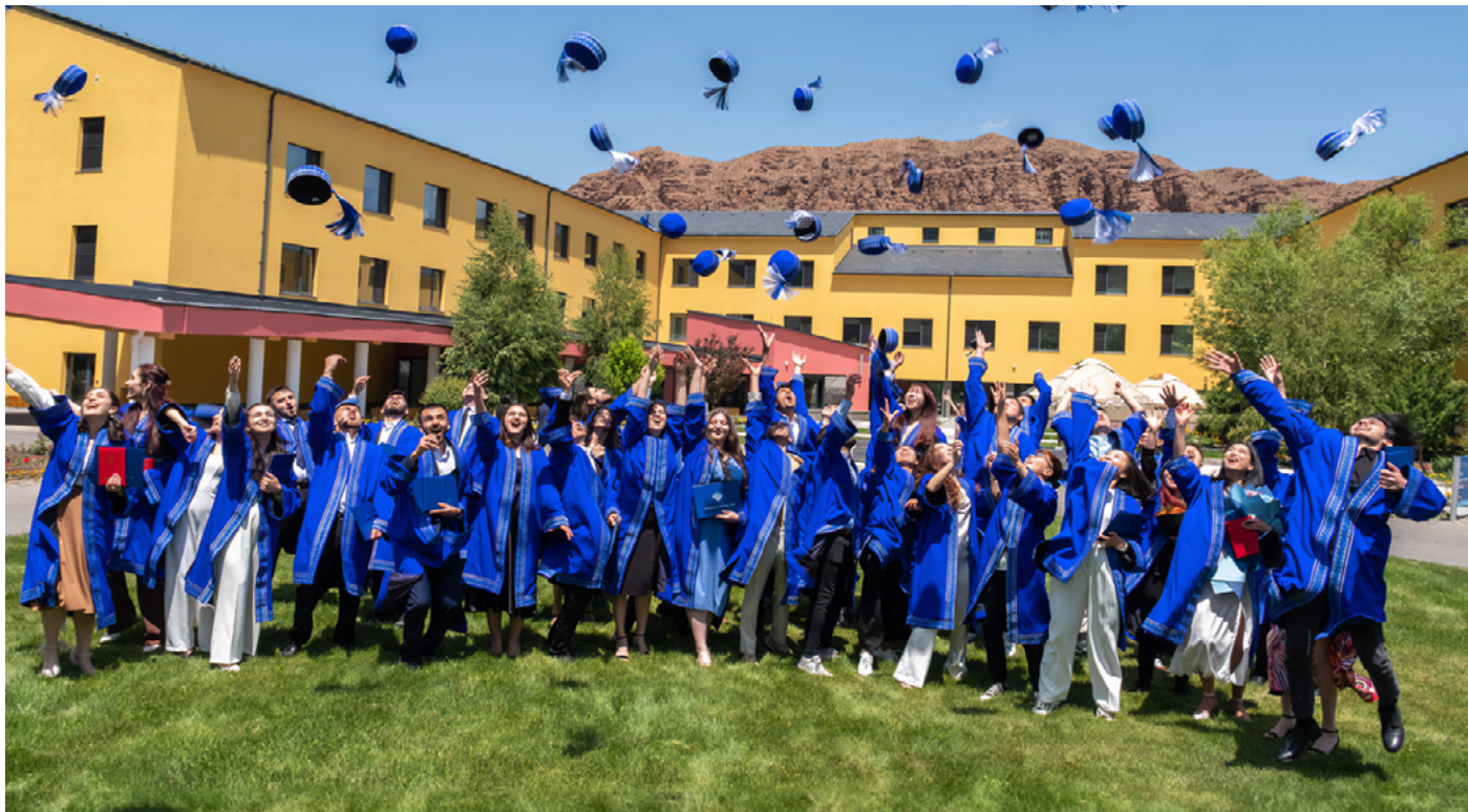
Студенты наслаждаются моментами радости и счастья после Церемонии вручения дипломов.

18 июня 2022 года на торжественном мероприятии, проходившем на фоне живописных гор Памира и Тянь-Шаня и транслировалось в прямом эфире по всему миру, Школа гуманитарных и точных наук Университета Центральной Азии провела третью выпускную церемонию одновременно в двух кампусах в Нарыне (Кыргызстан) и Хороге (Таджикистан).