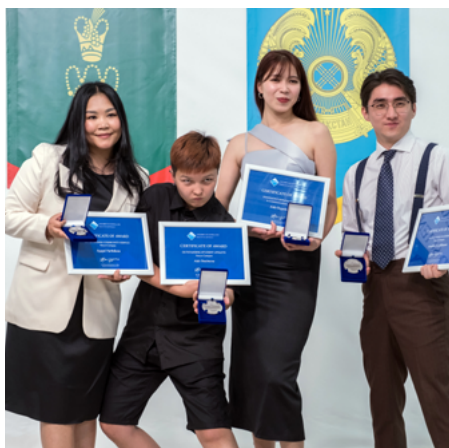
Награждённые выпускники кампуса в Нарыне.

Накануне церемонии вручения дипломов выпускникам 2023 года Школа гуманитарных и точных наук Университета Центральной Азии (УЦА) отметила достижения выдающихся студентов, церемония прошла одновременно в кампусах в Нарыне, Кыргызстан и Хороге, Таджикистан.