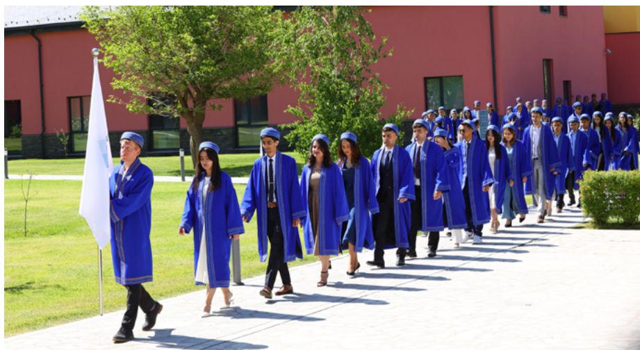
Шествие выпускников в кампусе в Хороге.