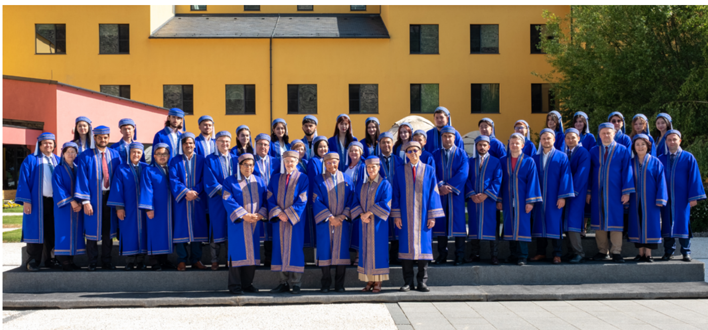
Выпускники Нарынского кампуса позировали для групповой фотографии вместе с преподавательско-профессорским составом и членами Попечительского совета УЦА.

На мой взгляд, вы являетесь воплощением нового поколения, открытого новым способам сотрудничества, общения и мышления, а также воплощением нового университета, готового к решению возникающих проблем и стремящегося выявить новые возможности, чтобы служить своим странам. Вы родились, когда Университет Центральной Азии еще только начал формироваться, и вы так же молоды, как и сам университет. Впереди вас и вашу альма-матер ждет яркое будущее. Я желаю, чтобы вы вместе с университетом продолжали черпать силу и вдохновение друг у друга на многие, многие десятилетия вперед.