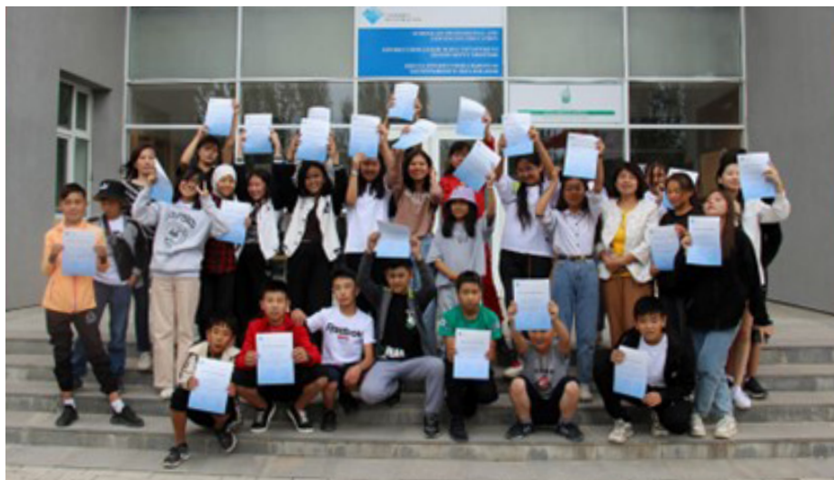
Студенты программы Летней школы с радостью показывают свои сертификаты о её окончании.

Помимо развлечений и игр, изучения английского языка и выступления в шоу талантов, 85 участников, 15 из которых были из социально незащищенных семей, с большим интересом работали над заданиями по освоению программного обеспечения Microsoft Office. Во время Летней школы учащиеся повысили уровень свободного владения английским языком, укрепили навыки работы в команде, налаживания контактов, а также приобрели лидерские качества и «мягкие» навыки. В конце программы ребята успешно сдали выпускные экзамены и получили сертификаты.