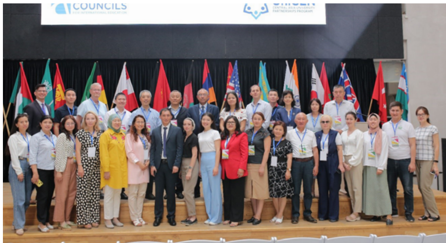
Участники на церемонии открытия семинара.