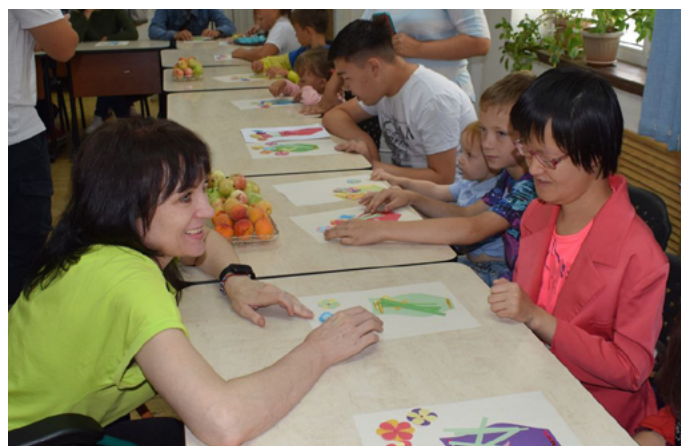
Специальные тренеры помогают развивать художественные таланты у детей с ограниченными возможностями.