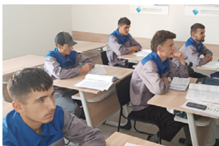
Студенты, изучающие основы электроники.

В рамках проекта «Местное преобразование: Преобразующее партнерство в Азии и в Африке» в июле 2022 года в учреждении профессионального образования – в ШПНО в Хороге (Таджикистан) стартовал техниче-