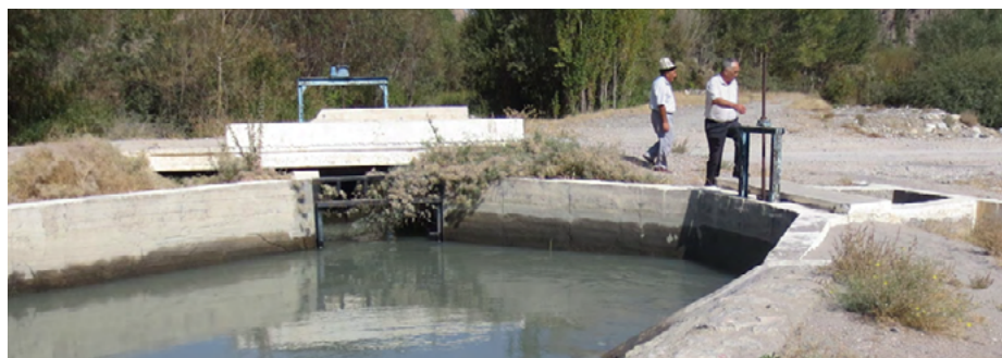
Вид на водозаборное сооружение канала Ак-Татыр, Кыргызстан.

Документ доступен для свободного скачивания на сайте УЦА: https://bit.ly/IPPA-WP69