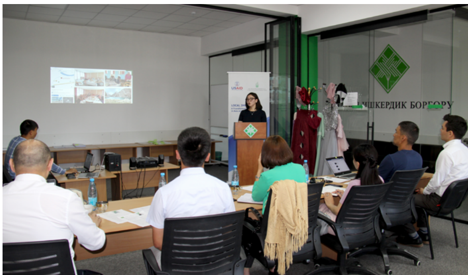
Студентка представляет свои бизнес-идеи для туристического гостевого дома в Нарыне

В Нарынском центре предпринимательства (НЦП) 40 участников завершили программу обучения предпринимательству. Это была третья группа участников программы обучения предпринимательству, которая проходила с апреля по июнь 2022 года.