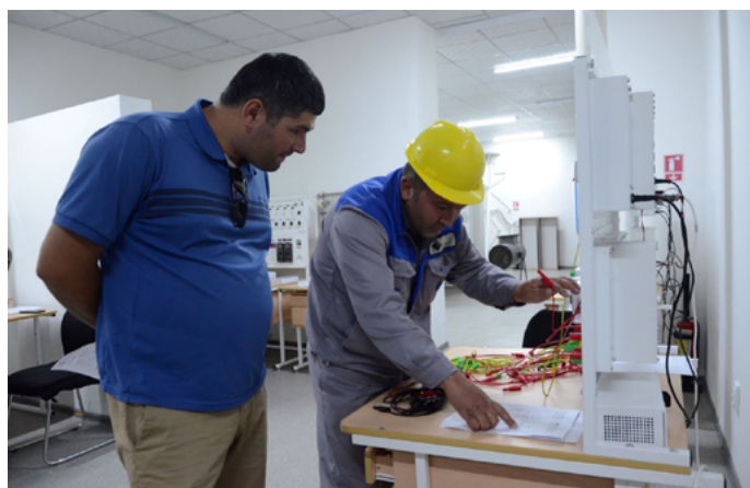
Стажер-электрик демонстрирует свои новые знания.

Для повышения местного потенциала по разработке, внедрению и управлению возобновляемыми источниками энергии ШПНО УЦА в партнерстве с Фондом Ага Хана и проектом ЮСАИД «Местное влияние» разработал и провел пилотное сертифицированное техническое обучение для электриков.