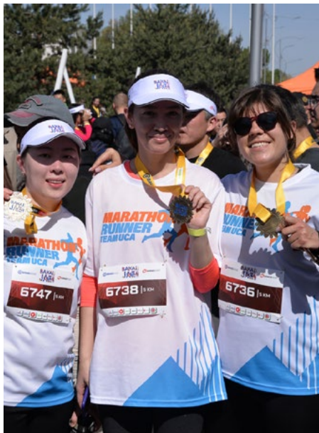
Сотрудники УЦА, принявшие участие в марафоне Jaz Demi.