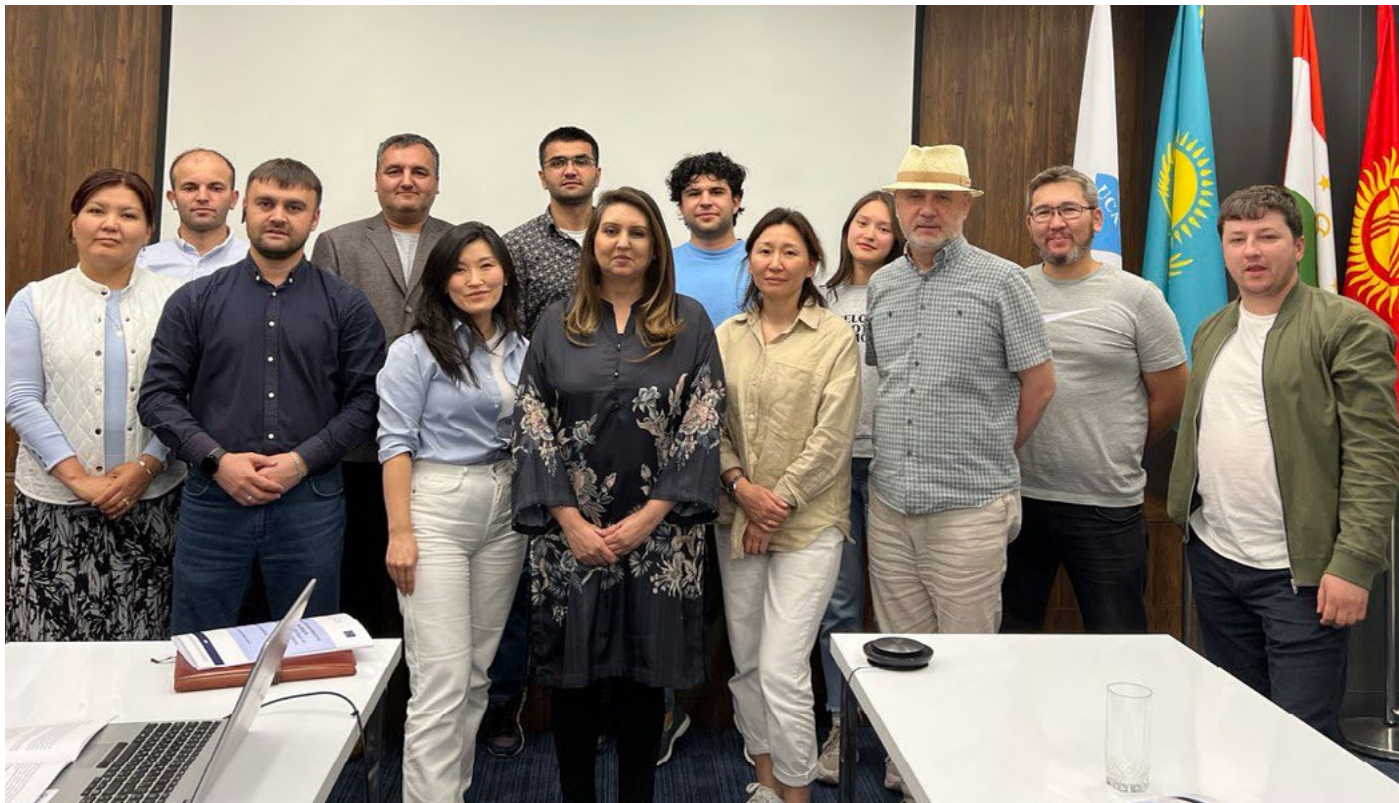
Участники первого цикла обучения для лидеров-предпринимателей в области зеленых технологий.

Школа профессионального и непрерывного образования УЦА (ШПНО) запустила первый цикл обучения для лидеров-предпринимателей с упором на применение зеленых технологий в строительном секторе. Цель этой программы состоит в поощрении внедрения зеленых технологий, особенно в Кыргызстане, Таджикистане, Афганистане и Пакистане. Этот тренинг, проводимый в