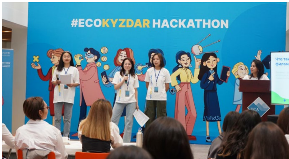
Молодые девушки представляют группе экспертов свой проект по переработке отходов «Волокно из пластиковых бутылок».

«Мы в УЦА осознали, что для достижения гендерного равенства требуется не только предоставление равных возможностей. Создавая программу исключительно для девушек, мы стремимся устранить гендерное неравенство в сфере STEM и обеспечить более справедливые условия для достижения успеха. Эти усилия вносят вклад в широкое видение канцлера УЦА Его Высочества Ага Хана, который подчеркивает то, что более инклюзивные и плюралистические об-