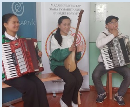
Учащиеся школы в Оше демонстрируют свой музыкальный талант на тренинге ОКНГН.

В целях сохранения традиционного музыкального наследия и развития творческого мышления молодых музыкантов страны Отдел культурного наследия и гуманитарных наук УЦА (ОКНГН) организовал серию музыкальных тренингов в более чем 20 музыкальных школах Ошской, Баткенской и Джалал-Абадской областей. В тренингах приняли участие свыше 100 учащихся и педагогов этих школ. Знакомство с музыкальным наследием страны происходило в рамках предмета «Этносольфеджио», формирующего музыкальное мышление и личность будущих исполнителей.