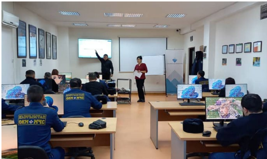
Обучение офицеров Министерства чрезвычайных ситуаций в кампусе ШПНО в Нарыне.

В целях повышения цифровой грамотности государственных служащих Кыргызстана Университет Центральной Азии (УЦА) в партнерстве с Министерством цифрового развития запустил проект «Digital CASA — Кыргызская Республика». Половину 1500 участников проекта составляют женщины. Программа обучения, пред-