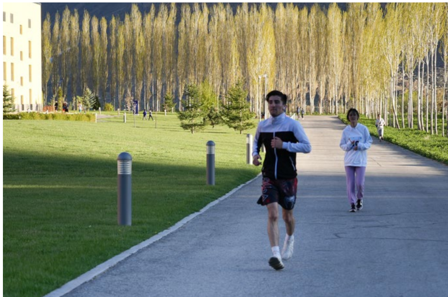
Студенты участвуют в забеге RUN4EARTH, RUN4FUTURE.

В рамках усилий УЦА по продвижению здорового образа жизни студенты и сотрудники УЦА приняли участие в марафонах в Хороге и Бишкеке, посвященных ежегодному празднованию Дня Земли.